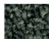
7913 L 31,01 RLV 6,65