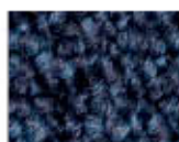
3842 L 28,48 RLV 5,64