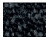
9960 L 35,23 RLV 8,61