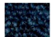
8901 L 22,32 RLV 3,60