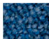
8412 L 29,20 RLV 5,92