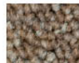
2044 L 45,62 RLV 14,99