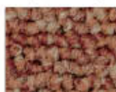
2041 L 30,01 RLV 6,24