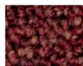
4421 L 27,21 RLV 5,17