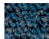
8313 L 33,40 RLV 7,72