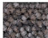
9104 L 45,86 RLV 15,16