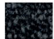
9990 L 23,42 RLV 3,92