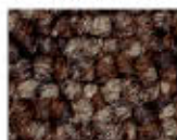
5411 L 41,56 RLV 12,22