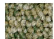
7074 L 47,78 RLV 16,62