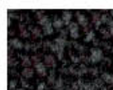
9001 L 20,00 RLV 2,99