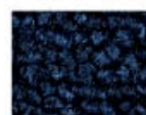
8811 L 21,17 RLV 3,29