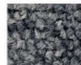
9955 L 44,97 RLV 14,52