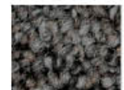
9093 L 37,66 RLV 9,90