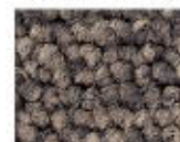
9094 L 43,92 RLV 13,78