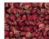
4322 L 32,28 RLV 7,21