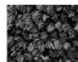
9985 L 29,22 RLV 5,92