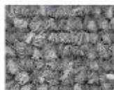
9930 L 54,13 RLV 22,09