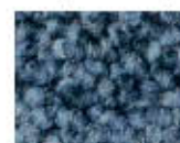
8803 L 39,83 RLV 11,15