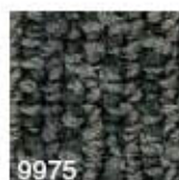
9975 L 30,52 RLV 6,45