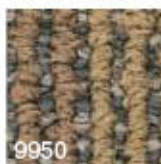
9950 L 36,07 RLV 9,04