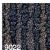
9022 L 28,72 RLV 5,73